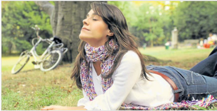
'Ho'oponopono' es un arte hawaiano que se presenta en el taller 'Soy el cambio'.

Por: REDACCIÓN EL TIEMPO | 6:45 p.m. | 10 de Abril del 2012