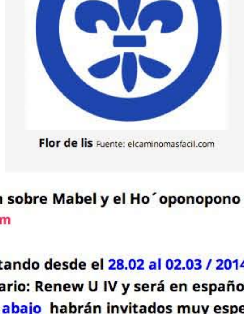
Flor de lis